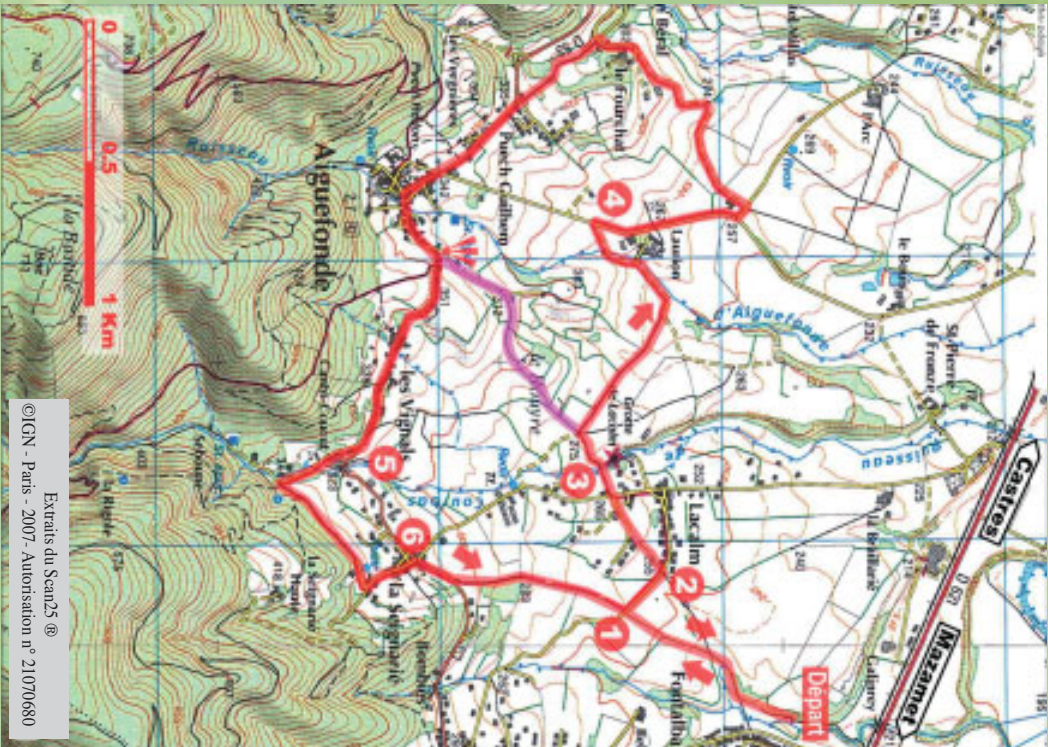
Extrats du Scan25 © ©IGN - Paris - 2007 - Autorisation n° 21070680